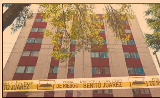
Los sismos dejaron 150,000 viviendas dañadas en seis estados del país; 55,000 de ellas, con pérdida total, según Realty World México. P4-5