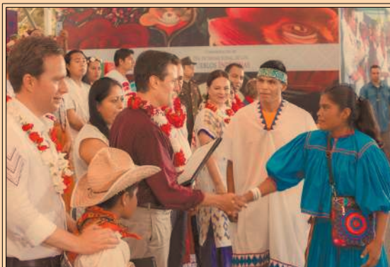
El presidente Peña Nieto conmemoró en Chiapas el Día Internacional de los Pueblos Indígenas. P48