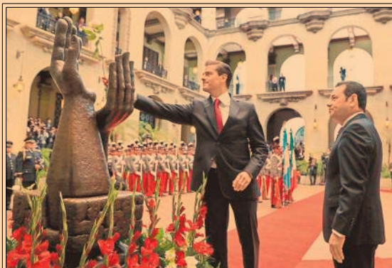
EPN solicitó a su homólogo de Guatemala que la extradición de Javier Duarte sea expedita. P42