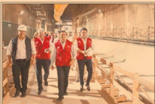
El presidente Enrique Peña Nieto negó que su gobierno espíe a los ciudadanos. P36 Y 40