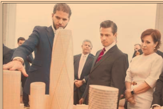
El presidente Peña Nieto refrendó su compromiso con el sector inmobiliario, mismo que duplicó su inversión en cinco años. P26