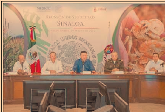
El titular de la Segob, Miguel Á. Osorio Chong, rechazó que exista espionaje gubernamental. P43