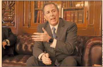
J. Antonio Meade, titular de la SHCP.