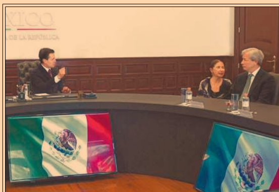
EPN recibió en Los Pinos al presidente y director general del banco JP Morgan, Jamie Dimon. P49

El precio del crudo alcanzó cifras que tenía en el 2015; producción en Venezuela toca mínimos. TE5 Y P33