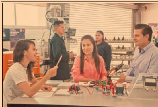
EPN visitó, en Aguascalientes, la Universidad Tecnológica El Retoño. eleconomista.mx

17.03% encareció la arena de mayo a mayo.