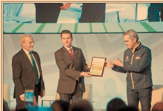
EPN anunció que 95% del sistema de abasto de agua dañado por sismos está restablecido.

4.80% anual fue el alza de la inflación subyacente.