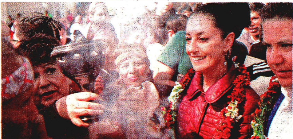
GRACIELA LOPEZ / CUARTOSCURO