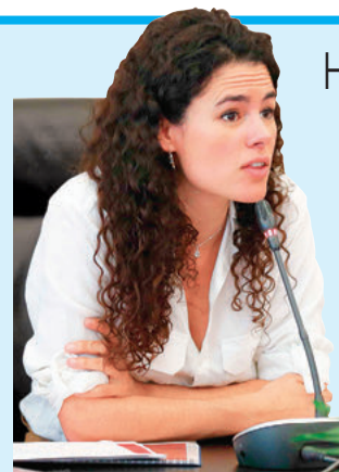
Luisa María Alcalde.