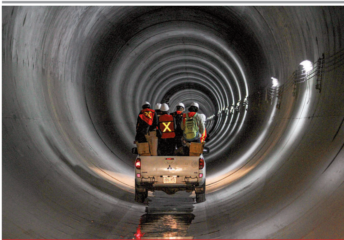
Personal de Conagua presentó ayer la obra terminada.