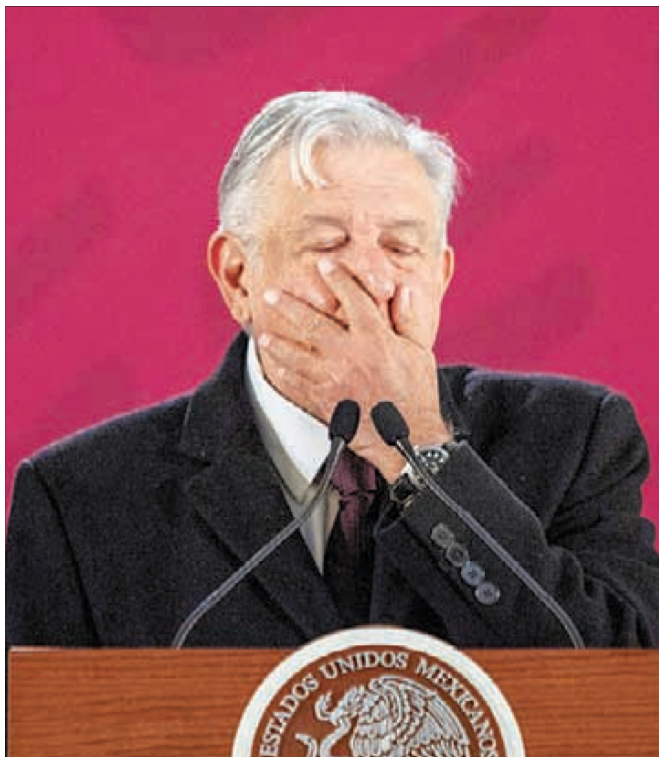
Andrés Manuel López Obrador, ayer durante su conferencia de prensa matutina en Palacio Nacional. Abordó el tema del desabasto de gasolina. Mencionó la palabra "ayuda" 15 veces y "apoyo" en 10 ocasiones.

Llegó inflación a 4.83% en 2018 ; impacta alza en productos agropecuarios .8