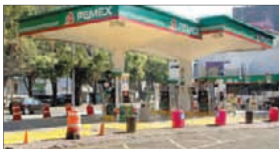
Algunas estaciones de gasolina en la CDMX tuvieron que cerrar ayer, por falta de combustible.

[ RODRIGO JUÁREZ Y BRAULIO COLÍN ] .3, 4 y 10