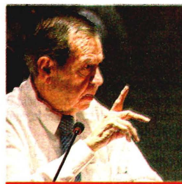
Porfirio Muñoz Ledo.

Ordena Muñoz Ledo investigar la denuncia de moches para Sergio Mayer