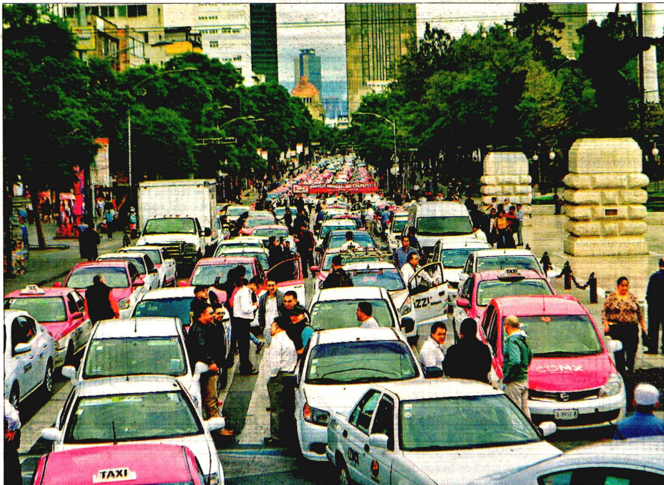
Avenida Juárez fue una de las vialidades primarias bloqueadas por los taxistas.

Sheinbaum acusa a gestores de estar detrás de los bloqueos; exigen quitar permisos a Uber y Cabify .9