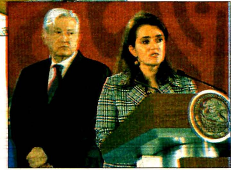
Andrés Manuel López Obrador y Margarita Ríos, directora del SAT, al anunciar la eliminación de condonaciones de impuestos.