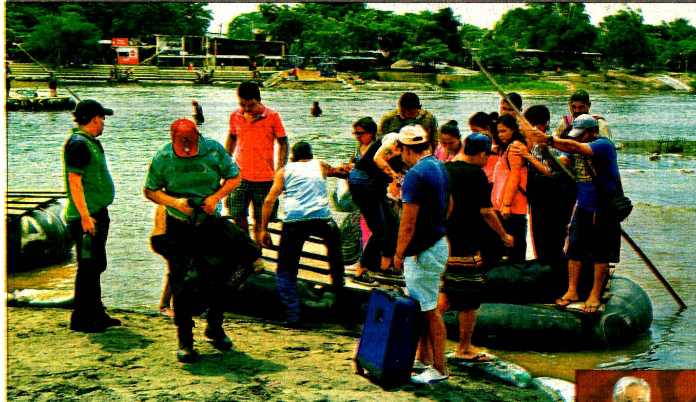
Migrantes centroamericanos cruzan el Río Suchiate en la frontera México-Guatemala, el mismo día en que la CEPAL presentó un plan para desarrollar la economía regional y frenar la migración hacia Estados Unidos.