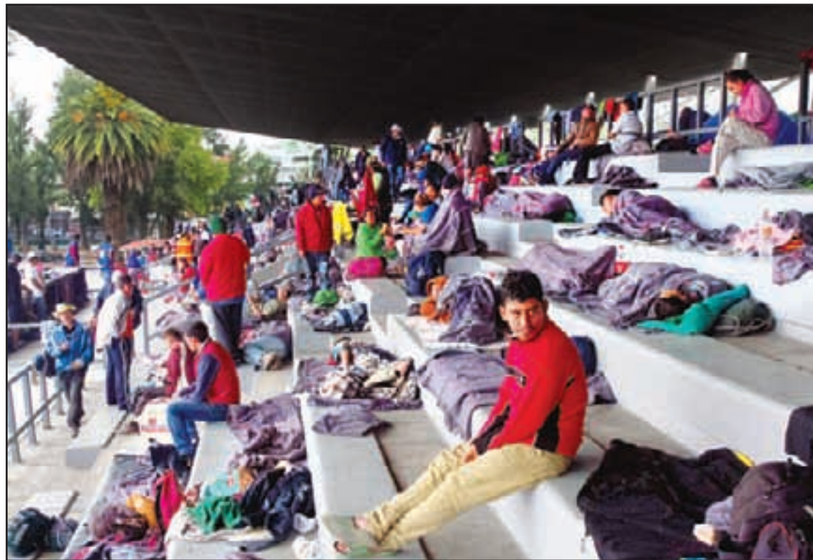
Primeros migrantes que llegaron a las gradas del estadio Jesús Palillo Martínez.