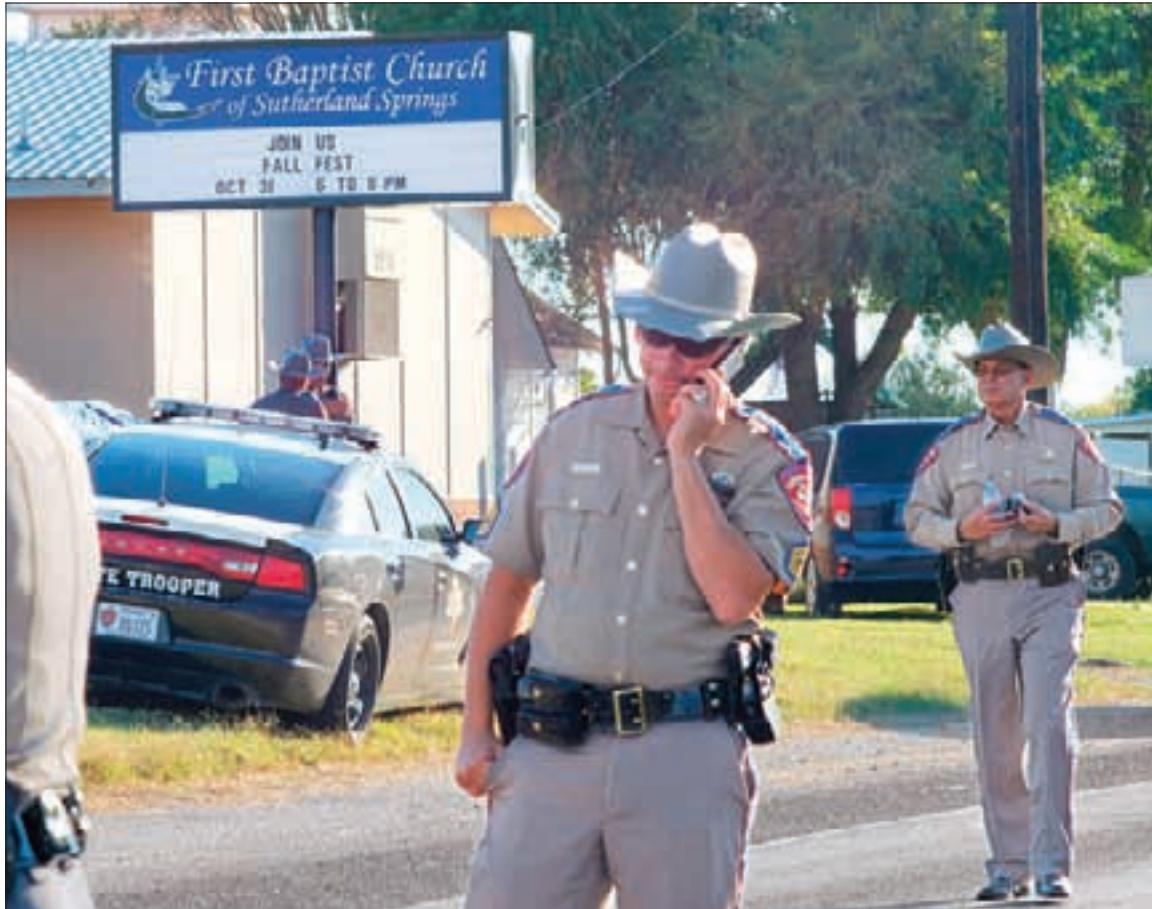
Soldados del Departamento de Seguridad Pública de Texas vigilan el lugar de la masacre en Sutherland Springs, Texas.

Un hombre armado, vestido de negro, entró a una iglesia baptista cercana a la ciudad de San Antonio y disparó a los feligreses