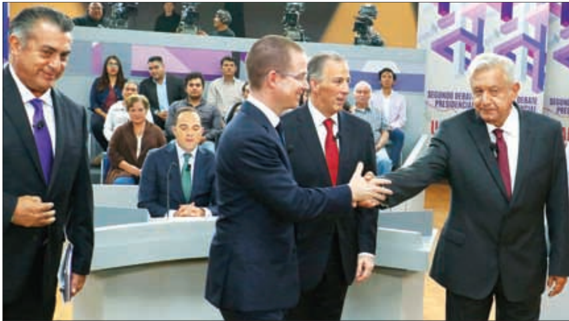
Ricardo Anaya y Andrés Manuel López Obrador se dijeron de todo en el segundo debate presidencial —anoche en Tijuana— y al final se estrecharon las manos, ante un atento José Antonio Meade y un Jaime Rodríguez satisfecho.

El Bronco forzó un abrazo entre AMLO y Ricardo Anaya; insiste en acusar a los partidos de ser el mal de México