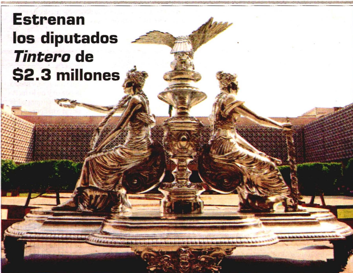
La escultura Gran Tintero Plateado , de 5.10 metros por 2.50 metros, con un costo de 2 millones 250 mil pesos, fue develada ayer por los líderes de los diputados en San Lázaro. La obra es una réplica del tintero original que data de finales del siglo XIX y se coloca cada sesión en el presidium de la Mesa Directiva. Los recursos fueron tomados de la partida "Difusión cultural" de la Cámara baja. (Vania González). .5

Estrenan los diputados Tintero de $2.3 millones