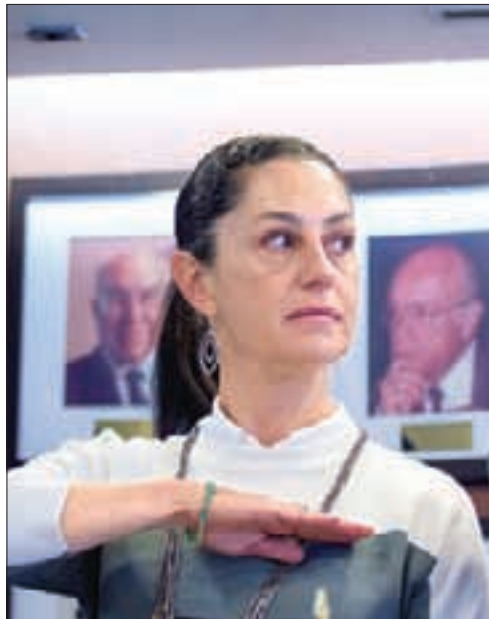
Riesgo inminente de que den uso electoral al Presupuesto 2018 de la CDMX, señala Claudia Sheinbaum .13