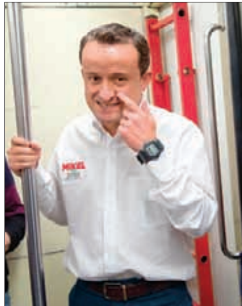
Mikel Arriola viaja en Metro, descarta aumento de la tarifa y dice que ampliará la red 15 kilómetros al año .13

Podrán votar 25 millones de ellos, de los cuales 14 millones lo harán por primera vez