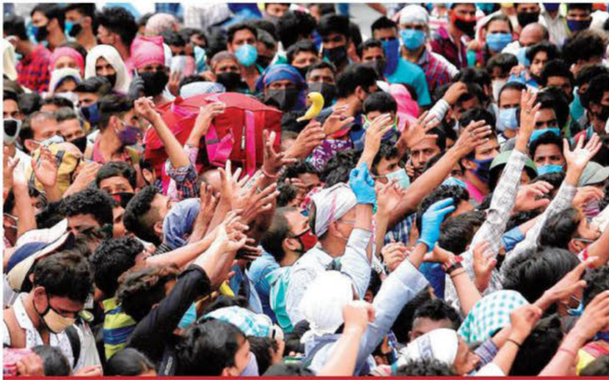
Trabajadores migrantes indios, turistas y estudiantes luchan por conseguir boletos de tren en Banganole, India, después de que la ciudad alivió el confinamiento para frenar la propagación del COVID-19.

Desde las otras 31 entidades se han dirigido pacientes sospechosos de COVID hacia la capital