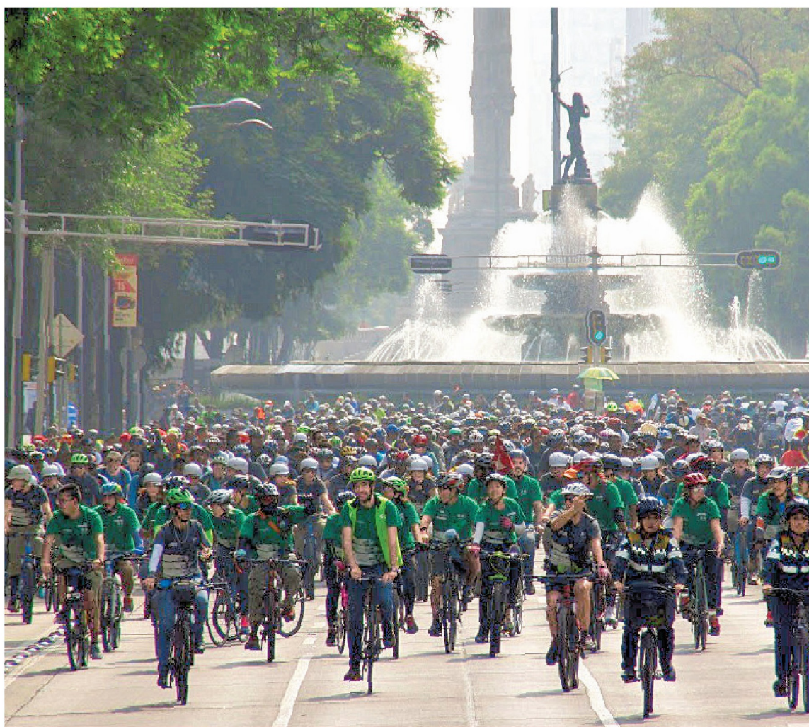
En la sexta edición del evento participaron 12,800 ciclistas; partieron de avenida Universidad con meta en Chapultepec. 12

Rodada rompe récord a favor de movilidad alternativa