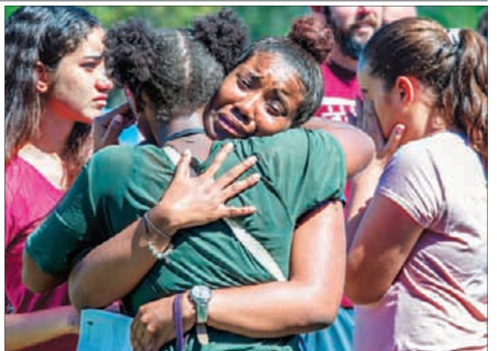
El presidente Donald Trump atribuyó a un problema de salud mental el ataque de un joven estadounidense en una escuela de Parkland, Florida, donde murieron 17 estudiantes. En el colegio, la comunidad realizó una ceremonia para rendir homenaje a las víctimas del 14 de febrero.