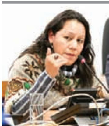
María Luis Albores, secretaria de Bienestar.

Mientras AMLO cierra la llave, la Secretaría de Bienestar eleva recursos a Organizaciones de la Sociedad Civil