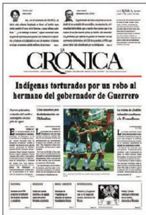
Nuestra primera portada hace 24 años.

En ese sentido se ha inscrito el Premio Crónica, que año con año reconoce lo mejor de México en los campos de la cultura, la ciencia, la academia, la comunicación social y los valores solidarios. Hombres, mujeres e instituciones de excepción han sido galardonados.