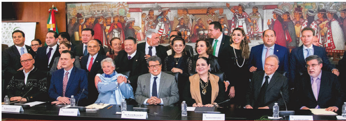
Olga Sánchez Cordero, secretaria de Gobernación; Alejandro Gertz Manero, Fiscal General de la República; y Julio Scherer, Consejero Jurídico de la Presidencia, acudieron ayer al Senado, donde esbozaron el contenido de un paquete de reformas al Sistema de Impartición y Procuración de Justicia, pero cuya entrega se pospuso para febrero.

Ante los cuestionamientos dentro y fuera de Morena, el Ejecutivo aplaza para febrero la entrega al Senado del paquete de nueve reformas al sistema de Impartición y Procuración de Justicia