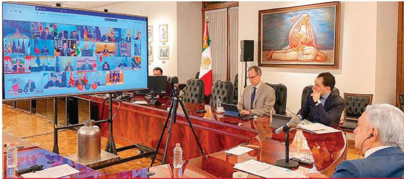
El presidente Andrés Manuel López Obrador, al participar ayer, desde Palacio Nacional, en una conferencia virtual del G-20. Lo acompañan integrantes de su gabinete.