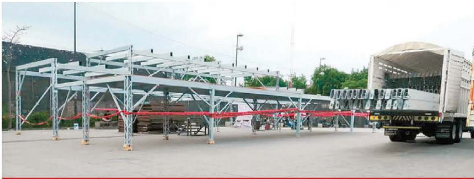
Integrantes del Comité Organizador del viacrucis comenzaron ayer la instalación de la infraestructura de los escenarios en la explanada del Jardín Cuitláhuac, donde se escenifica el concilio, el juzgamiento y la sentencia, así como la última cena y el lavado de manos de Poncio Pilatos. 11 y 12

... Y LOS OCHO BARRIOS YA ESTÁN INSTALANDO EL ESCENARIO