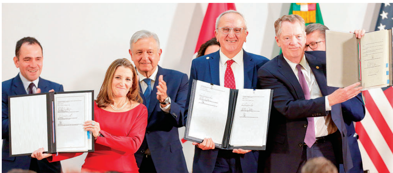
Christya Freeland, viceprimera ministra de Canadá; Jesús Seade Kuri, subsecretario para América del Norte de la SRE; y Robert Lighthizer, representante comercial de EU, muestran los documentos firmados de las modificaciones al T-MEC, en el Salón Tesorería de Palacio Nacional. Atestiguaron el presidente Andrés Manuel López Obrador y los secretarios de Hacienda y del Trabajo, así como el líder del Senado.

El exsecretario de Seguridad Pública es acusado de perjurio y de conspiración para el tráfico de cocaína