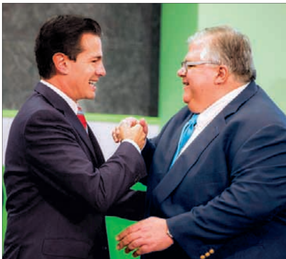
El presidente Enrique Peña Nieto saluda al gobernador del Banco de México, Agustín Carstens, durante el evento en el que se anunció el incremento al salario mínimo. Probablemente sea el último encuentro público de ambos. Carstens, quien dirigió al Banxico desde 2010, será el gerente general del Banco de Pagos Internacionales en Basilea, Suiza, a partir del 1 de diciembre.

El alza se compone de un "incremento anual" y de "un monto de recuperación independiente", para que no impacte en los contractuales