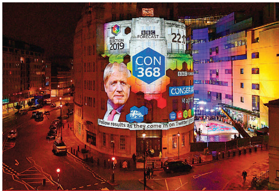
Una foto que distribuyó la BBC muestra en la Broadcasting House, Londres, los resultados de las encuestas de salida que dan como triunfador a Boris Johnson y su Partido Conservador, lo cual acelerará la salida de GB de la Unión Europea.

Obtienen mayoría absoluta los conservadores; brexit en puerta