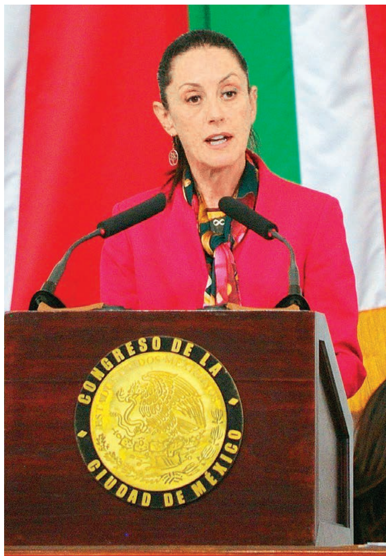
Claudia Sheinbaum al rendir ayer su Primer Informe de Gobierno en el Congreso capitalino.

Sheinbaum resaltó la estrategia "Abogadas de las Mujeres" la cual, dijo, está presente en las 71 coordinaciones territoriales, proporcionando asesoría y apoyo las 24 horas, los 365 días del año en denuncias por violencia sexual y familiar. 10