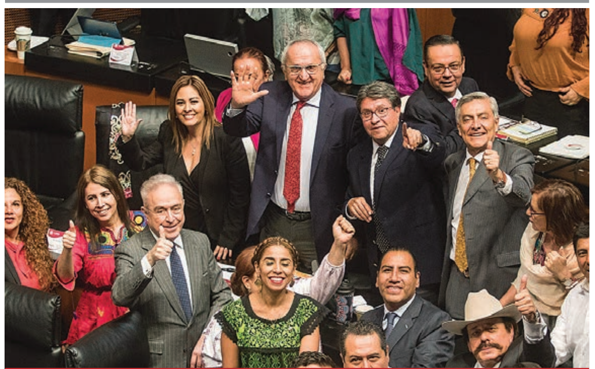
Senadores de Morena, encabezados por Ricardo Monreal, festejaron la ratificación del T-MEC. Los acompaña Jesús Seade Kuri, subsecretario para América del Norte y jefe negociador del tratado comercial.