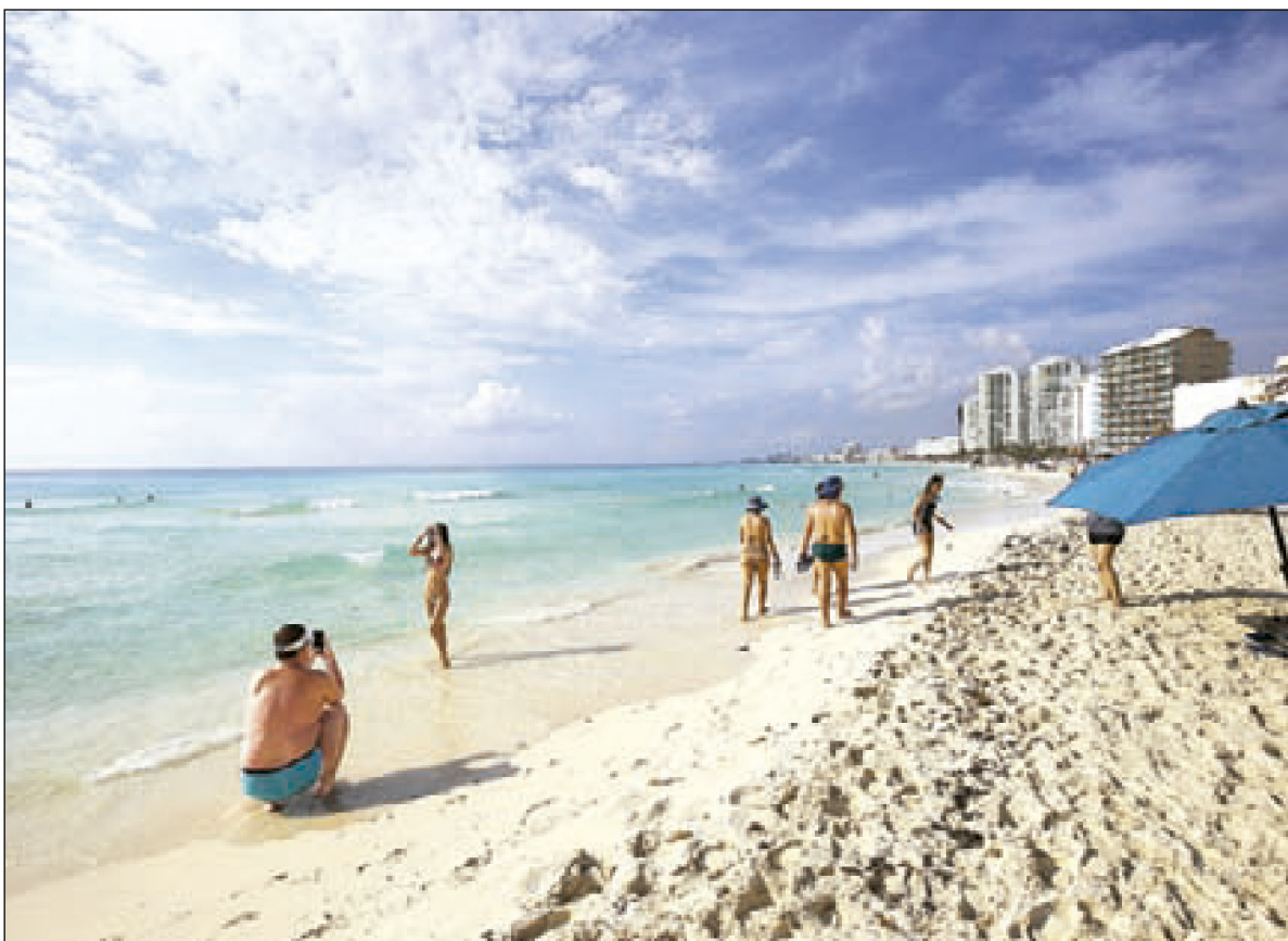
Algunas playas de Cancún amanecieron por fin libres de sargazo para el disfrute de los turistas que decidieron pasar este fin de semana largo en ese destino turístico. .7