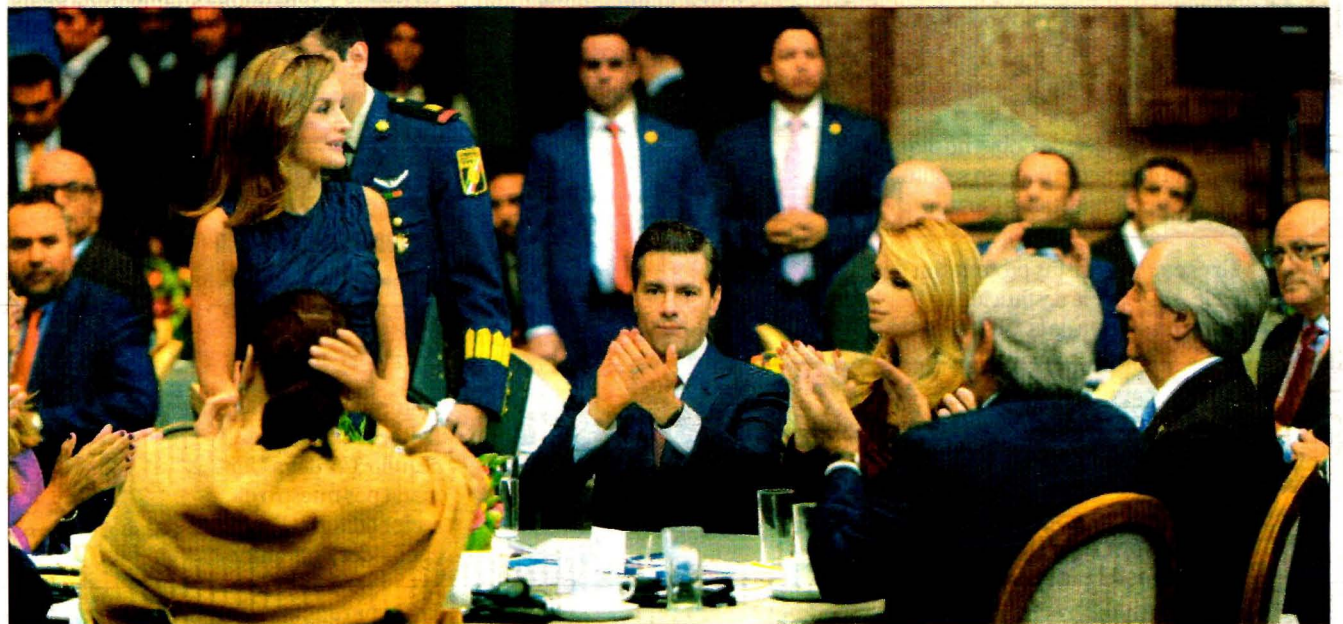
El presidente de México, Enrique Peña Nieto, encabezó ayer la inauguración de la Cumbre Mundial de Líderes Contra el Cáncer 2017, en el Palacio de Minería. Lo acompañan la reina Letizia, su esposa Angélica Rivera, y el mandatario de Uruguay, Tabaré Vázquez.