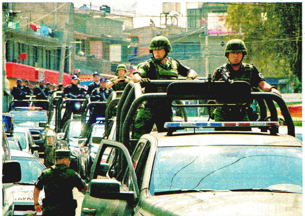
Militares integrantes de la Guardia Nacional, con un brazalete de la GN, fueron desplegados ayer en la colonia Desarrollo Urbano Quetzalcóatl, considerada la más peligrosa de Iztapalapa. La jefa de Gobierno, Claudia Sheinbaum, encabezó el arribo del nuevo cuerpo policiaco, el cual tendrá 450 elementos en total en esa alcaldía. (Braulio Colín).

La Guardia Nacional ya entró a Iztapalapa