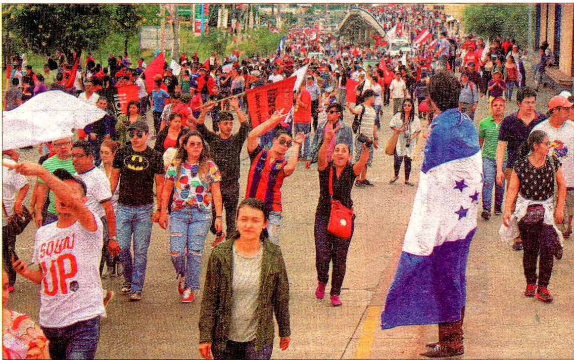
Miles de hondureños exigen el recuento voto por voto para esclarecer que no hubo fraude electoral luego de la caída del sistema.