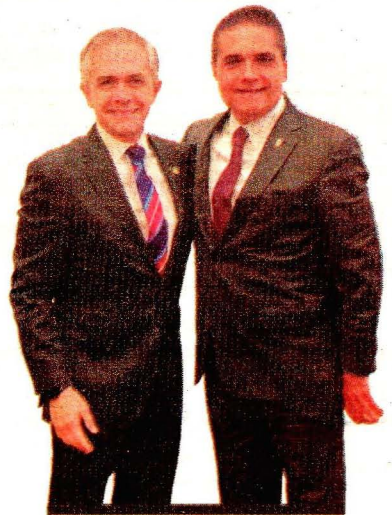
Miguel Ángel Mancera recibe el apoyo de Silvano Aureoles.