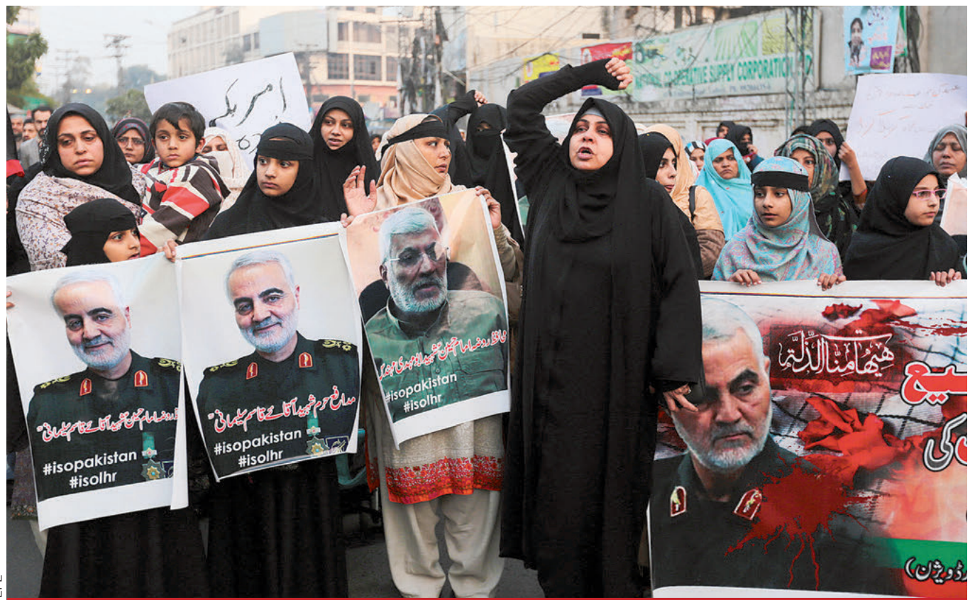
La muerte de Soleimani encendió la furia en Teherán, donde miles de proiranes protestaron frente a la embajada de EU al gritarle "Muerte a América".