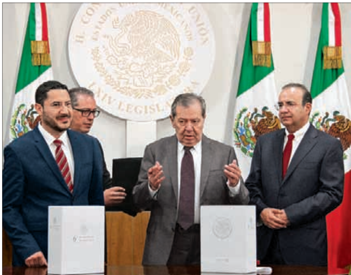
El documento está en manos del Legislativo, fue entregado a los legisladores, quienes tienen la posibilidad de convocar a los secretarios de Estado a efecto de discutir con ellos los aspectos que dejen dudas o deban ser profundizados. El nuevo periodo de sesiones ha dado inicio... .9

VI Informe, entregado; el presidente Peña hablará a la nación mañana