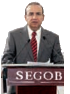
Alfonso Navarrete Prida.

El jefe de Gobierno, se comprometió a reforzar la seguridad de las aduanas de los penales para evitar el ingreso de objetos prohibidos, además, se mantendrá una revisión constante para erradicar estas prácticas.