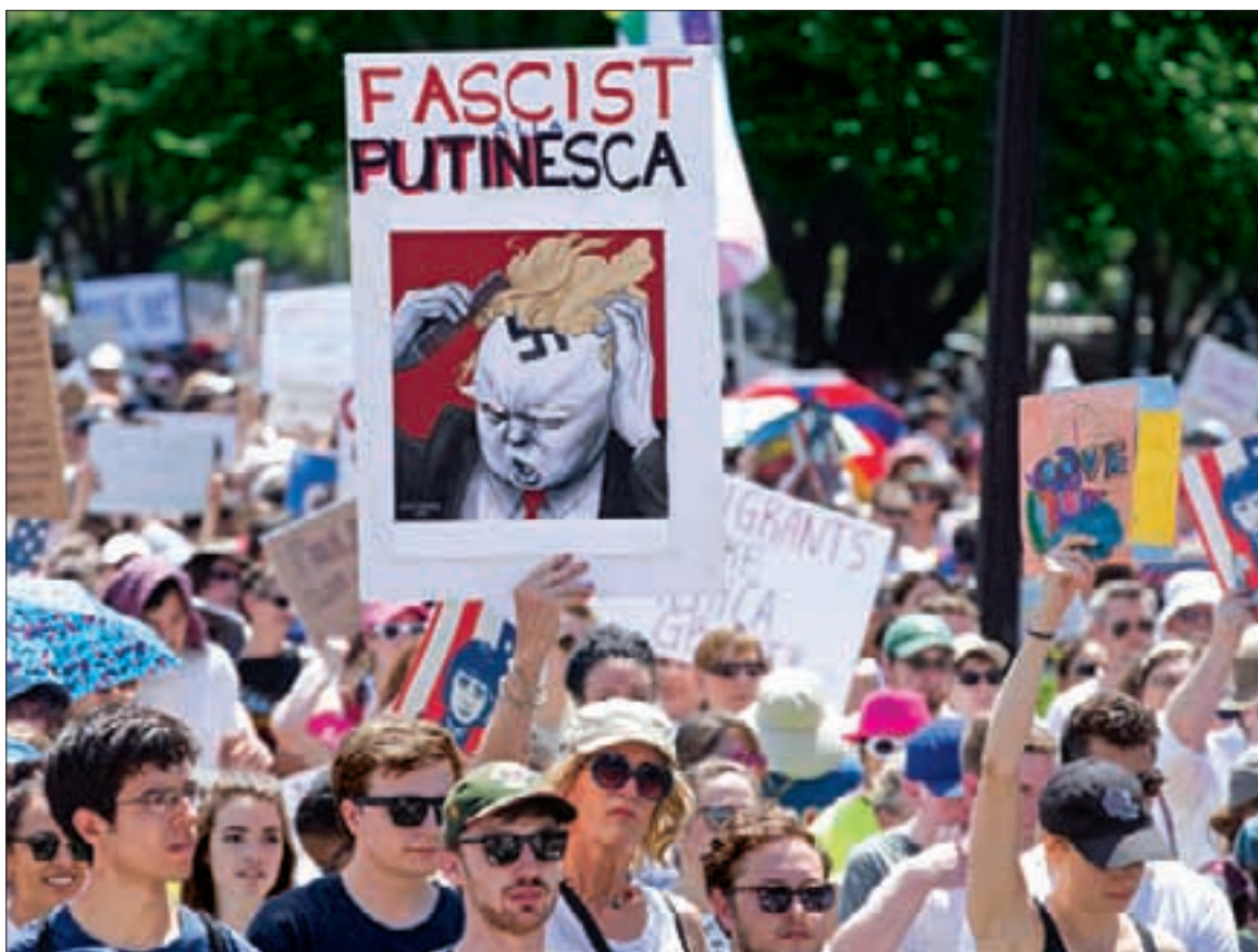
■ “Vergüenza”, entre otras muchas leyendas, se leyó en las pancartas de quienes salieron a protestar, por miles, en las ciudades estadounidenses, contra las políticas antiinmigrantes