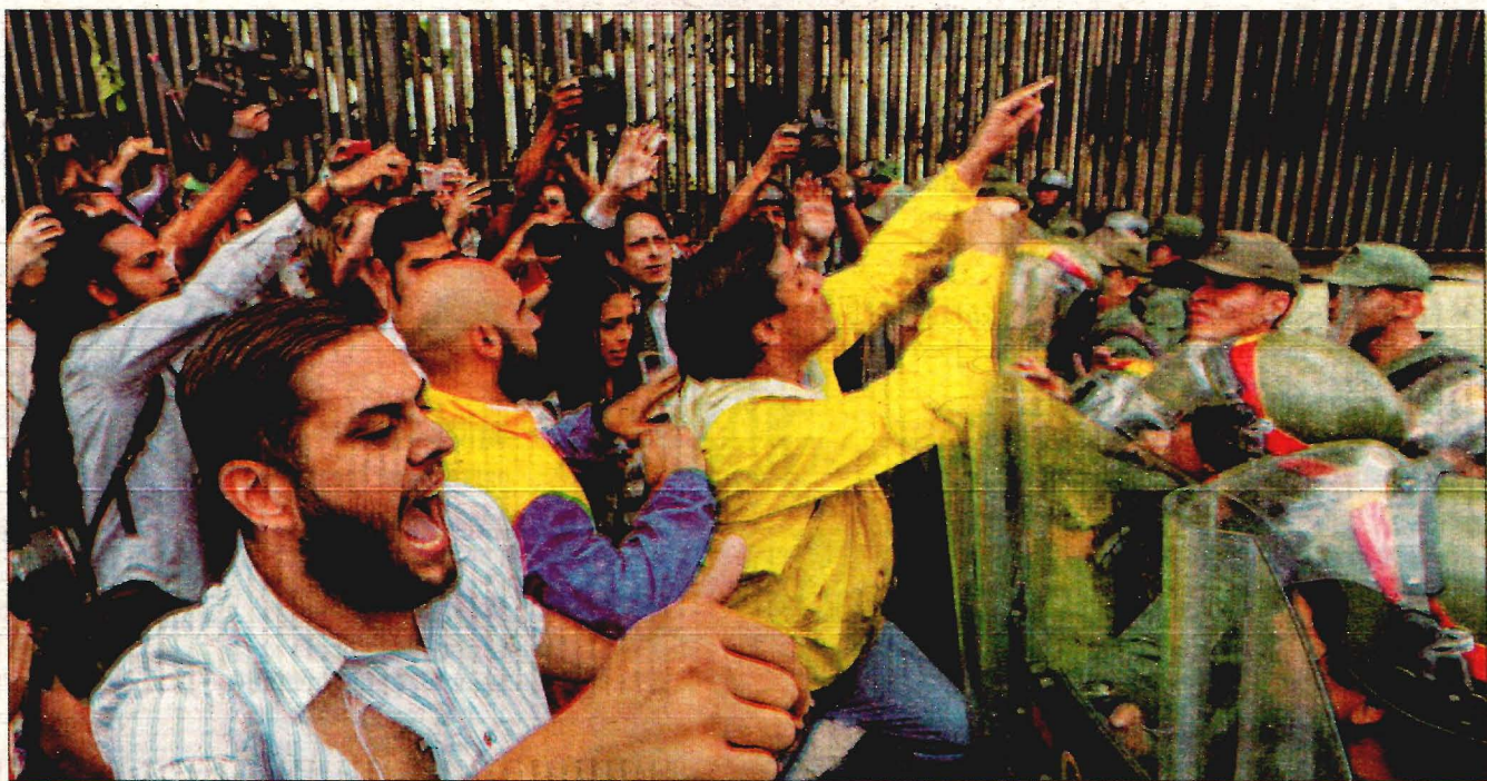
Soldados de la Guardia Nacional impiden el paso de un grupo de diputados que protestan en la sede del Tribunal Supremo de Justicia en Caracas. Decenas de dirigentes opositores rechazaron ayer la sentencia que publicó el miércoles el Tribunal Supremo, en la que asume las competencias del Parlamento, un dictamen que el antichavismo ha ponderado como un "golpe de Estado" contra el Legislativo.

Supera expectativas el Programa Nacional de Infraestructura; generará inversiones por 7.7 billones de pesos .22