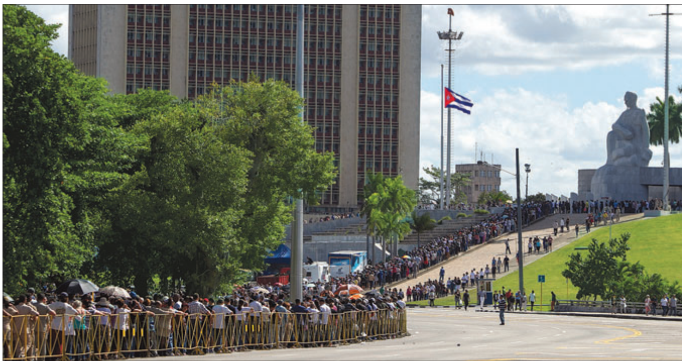
Cientos de cubanos participan en las honras fúnebres al fallecido líder de la Revolución Cubana, Fidel Castro, en la Plaza de la Revolución de La Habana.