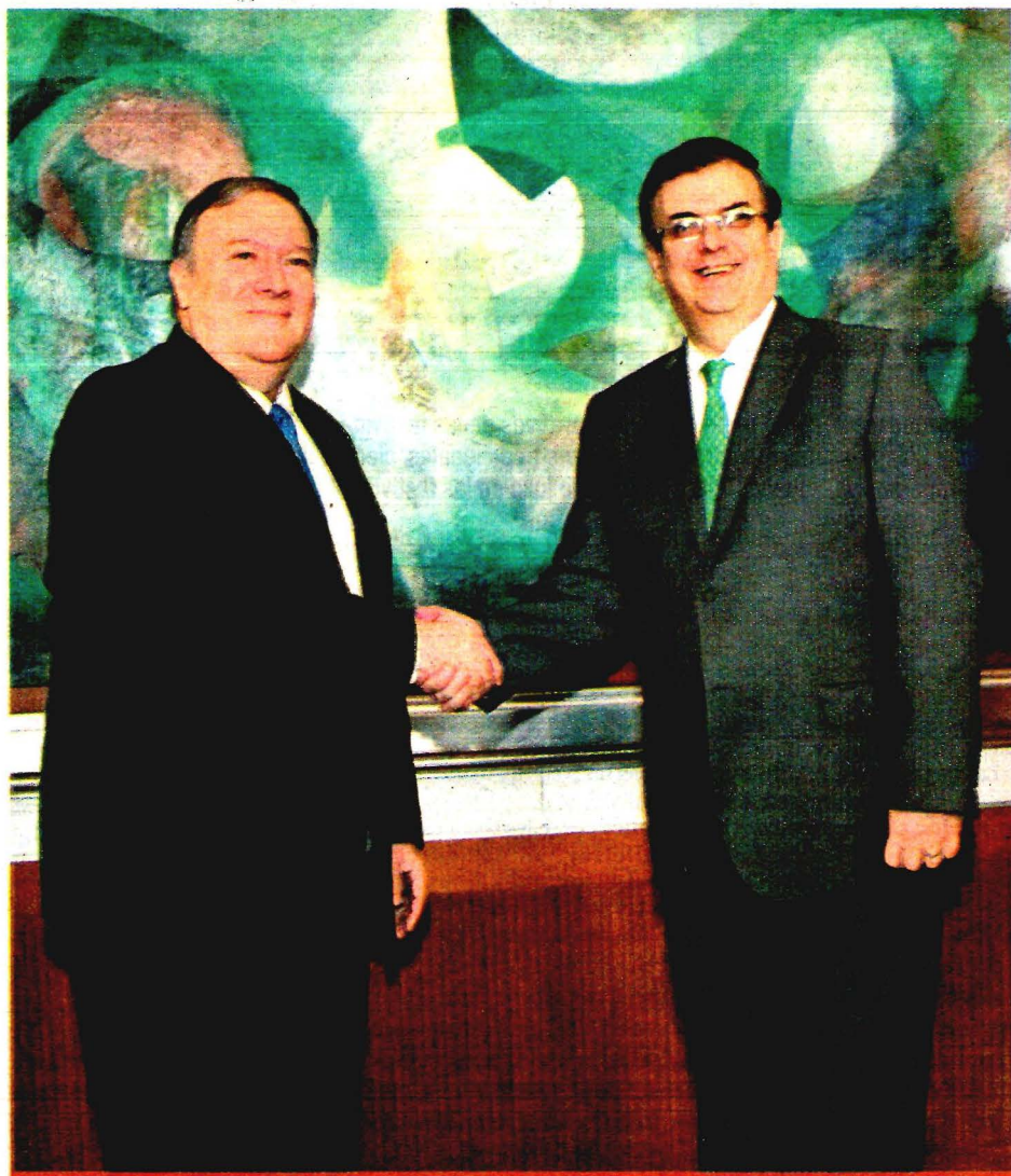
El secretario de Estado de EU, Michael R. Pompeo, y el canciller mexicano, Marcelo Ebrard, se reunieron ayer para revisar, entre otros, el tema migratorio.

Función Pública y SHCP documentan obras inexistentes, sobrepeso, gastos ajenos a los autorizados y falta de reportes de ejecución