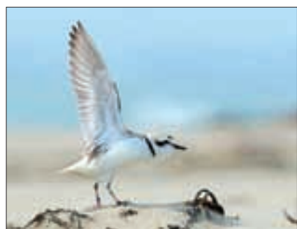
Chorlo, ave endémica de la zona.

Evaluación de AMLO detecta necesidad de otros $88,000 millones para la megaobra; tendría que colocar bonos para obtenerlos