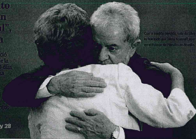
Con la mirada perdida, Lula da Silva es abrazado por Dilma Rousseff ayer en el Palacio del Planalto en Brasilia.

■ El Congreso de Brasil inició proceso de destitución de la mandataria; ella tiene 10 días para presentar su defensa ■ Transparencia Internacional lamenta que Rousseff blinde a su padrino político ■ Conatos de enfrentamientos en la ceremonia en que el ex presidente tomó posesión del cargo .27 y 28