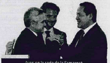
Ayer, en la sede de la Semarnat.

Acuerdan Pacchiano, Eruviel y Mancera cuatro puntos para mejorar la calidad del aire