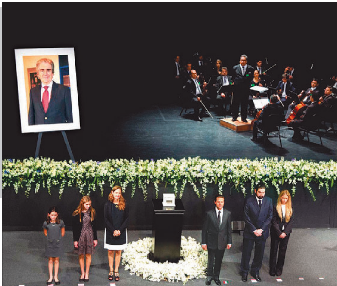
En el homenaje luctuoso a Rafael Tovar y de Teresa, en el Centro Nacional de las Artes, el presidente Enrique Peña Nieto expresó sus condolencias a sus familiares y montó dos guardias de honor, la primera acompañada de familiares, y la segunda de integrantes del Gabinete Legal del Gobierno de la República.

Se hacen gestiones para financiar el proyecto, que busca frenar el mal uso de datos personales, adelanta el director del Renapo