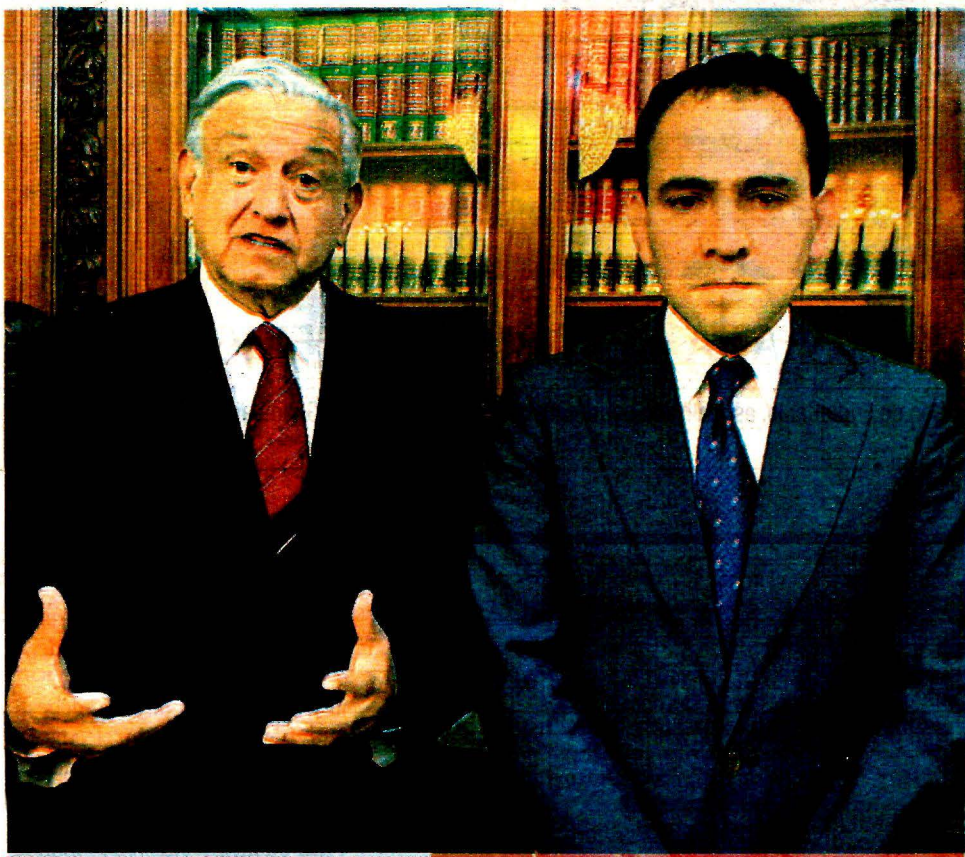
El presidente López Obrador, al designar a Arturo Herrera al frente de la Secretaría de Hacienda.